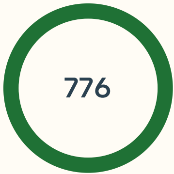
განცხადებები და საჩივრები