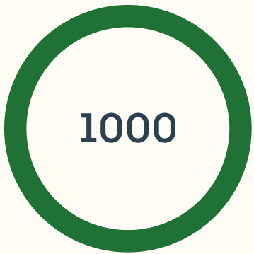
გაგზავნილი რეკომენდაციები კომპანიებში გაგზავნილი შუამდგომლობები